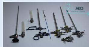
Set de Resección Transuretral Monopolar