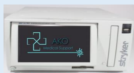
Grabadora Lector Stryker