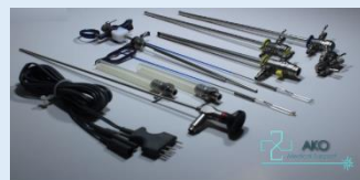
Resección Transuretral Bipolar