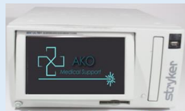
Grabadora Lector Stryker