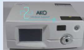
Fuente de Luz