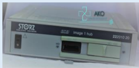
Consola cámara STORZ